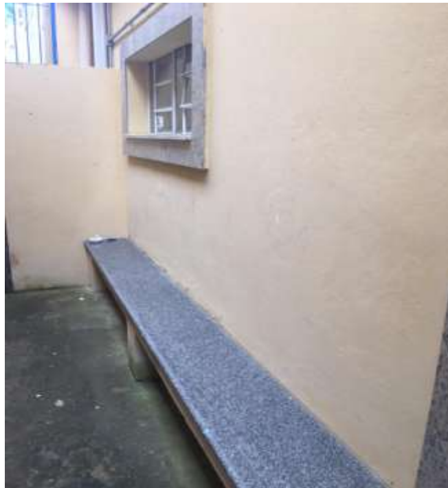
Foto da parede externa do arquivo a qual será quebrada para a ampliação do arquivo.